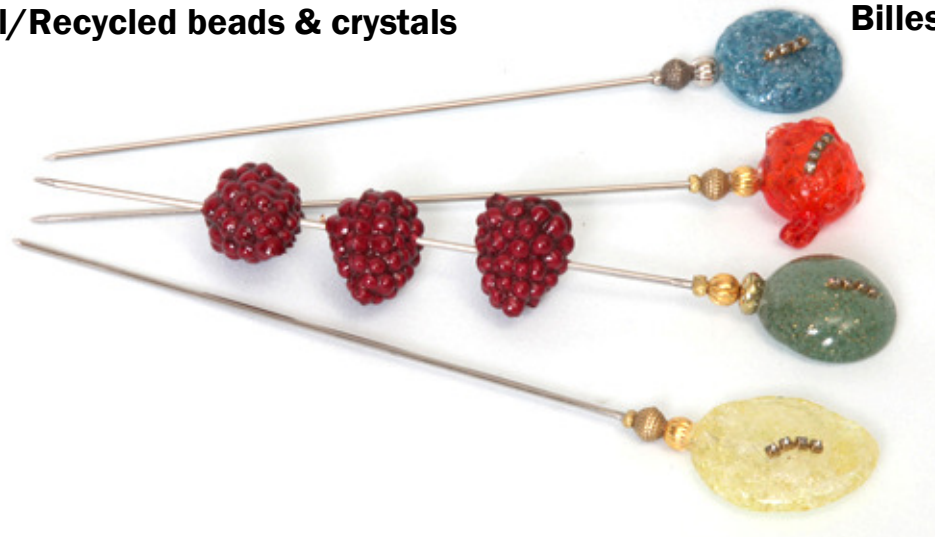
Billes recyclées et crystal/Recycled beads & crystals